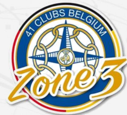
Photo-reportage des dernières activités