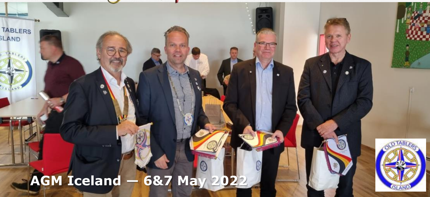
AGM Iceland — 6&7 May 2022